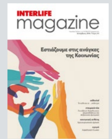
Περιοδική Έκδοση της INTERLIFE Ασφαλιστικής